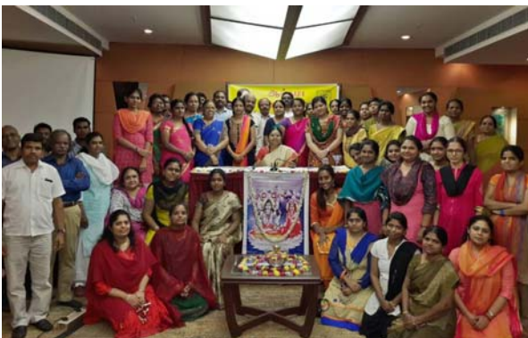
Gurujī with Alpha Siddhas at Psychic Energy Workshop in Chennai