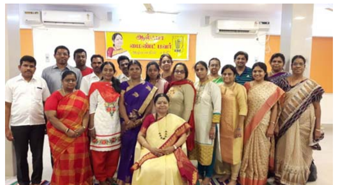
Gurujī with Alpha Siddhas at Spiritual Counseling workshop in Chennai