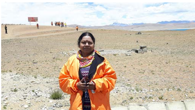
Guruji near Mount Kailash