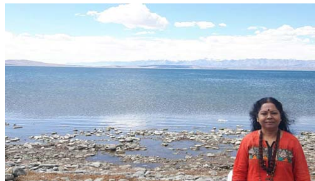
Guruji near Manasarovar Lake