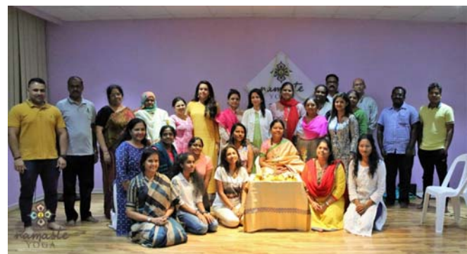
Guruji with Alpha Siddhas at Sanjeevani Workshop in Dubai

For further enquiries please contact AMP office: +919841272146