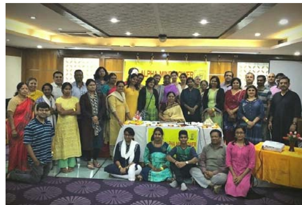
Guruji with Alpha Siddhas at Tejas Chakra Workshop in Bangalore